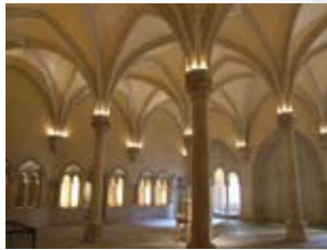
Basiliek van de Saint-Remi Abdij REIMS