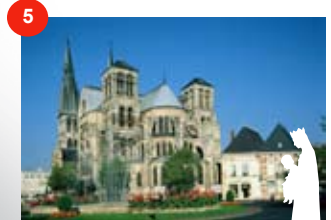
Kerk van Notre-Dame-en- Vaux CHALONS-EN-CHAMPAGNE