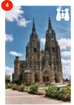
Basiliek Notre-Dame L'EPINE