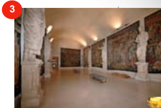
Palais du Tau REIMS